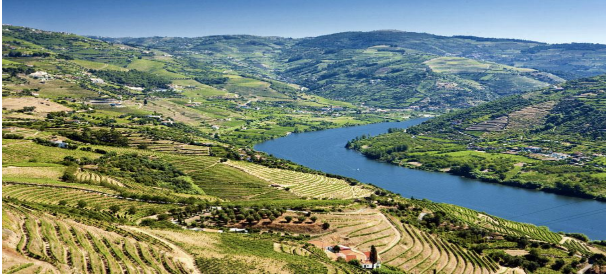
Resim 1: Douro Vadisi'nden Bir Görünüm

Douro nehri büyüleyici güzelliğiyle kıvrıla kıvrıla akarken, batı yönündeki dağlar nemli havayı, kuzeydeki dağlar da soğuğu keserek üzüm yetiştiriciliği için adeta ideal bir iklim oluşturmaktadır. Nehre doğru dik olarak inen taşlı toprak yapısı muhteşem bir manzarayla birlikte en iyi cins üzümlere de ev sahipliği yapmaktadır (Resim 1). Yaklaşık 25 bin hektarlık bu alan üzüm bağları ile kaplıdır. 500'den fazla üzüm cinsinin kaydedildiği bölgede bağcılık yüzlerce yıl öncesine dayanmaktadır. Romalılar dönemine kadar uzanan bağcılık 1100'lü yıllarda Portekiz Hıristiyan Kilisesi'nin teşviki ile bölgede iyice yayılmıştır. Kaliteli şarapların üretimi ise 1600'lü yılların ortalarını bulmaktadır. Dünyaca ünlü Porto Şarabının (Port Wine) üretimi de bölgeye özgü üzümler ve şarabın mayalanmasında konyak kullanılmasıyla 17. yüzyılda gerçekleşmiştir. Bölge bugün Porto Şarabı başta olmak üzere Taylor's, Dow's, Graham's ve Fonseca gibi dünya çapında bilinen markalarla anılmaktadır (Carvalho, 2015).